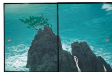
NWM 長野県立美術館 Nagano Prefectural Art Museum